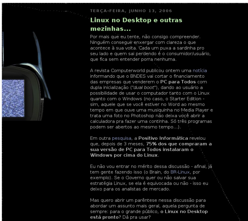
FIG.2 – Imagem do texto “Linux no desktop e outras mesinhas...”