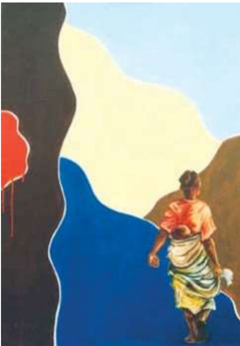
Tela 2: Etona Sem título. Técnica: óleo sobre tela Sem data