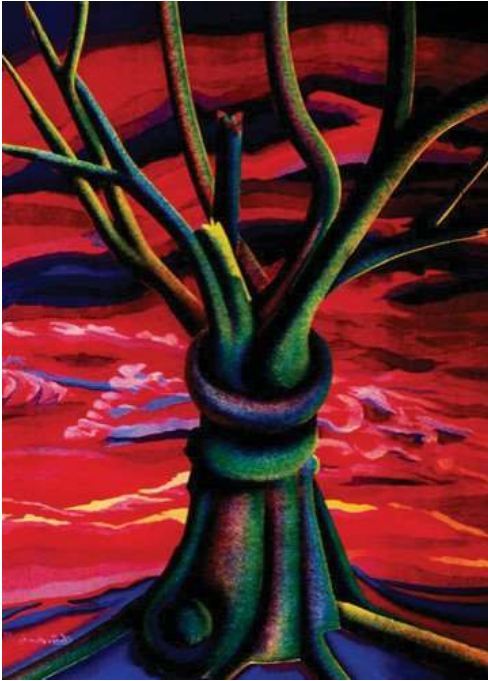
Tela 1: Eleutério Sanches “Alquimia da árvore” (motivação Imbondeiro) Técnica: óleo têmpera sem tela – Ano: 1991